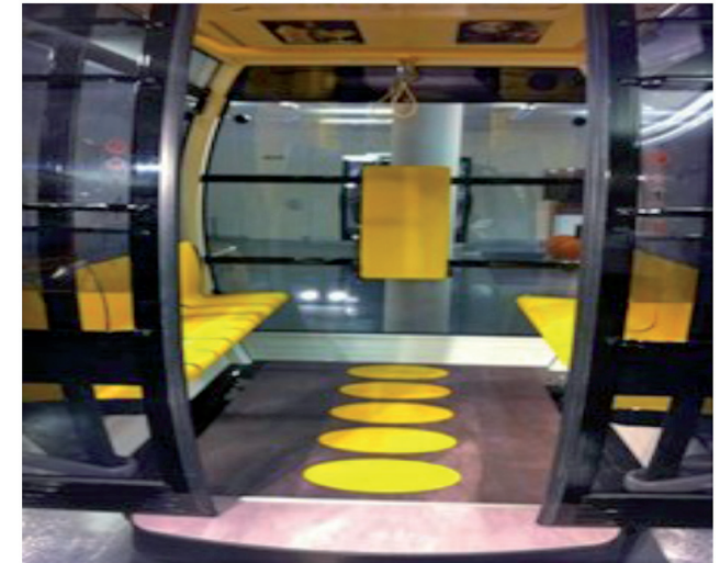
Innenansicht der neuen Kabine